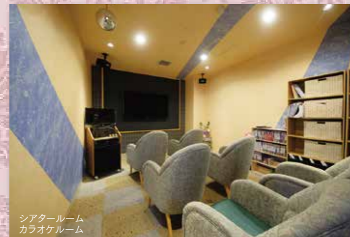
シアタールーム カラオケルーム