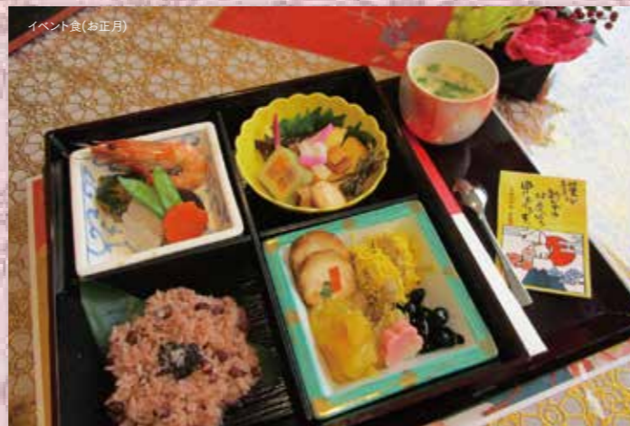
イベント食(お正月)